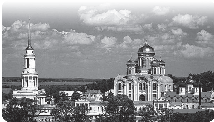
МОНАСТЫРЬ В ЗАДОНСКЕ

В конце службы мы получили благословение у батюшки на дальнейший путь. Благословляя, он весело сказал: «Да, Ростов здесь совсем рядом, всего 700 километров, у нас многие туда ездят». Вот с таким настроением, немного передохнув, мы и тронулись дальше в путь. К вечеру прибыли в Ростов-на-Дону, где нас ждали кое-какие дела, остановились в гостинице, по-