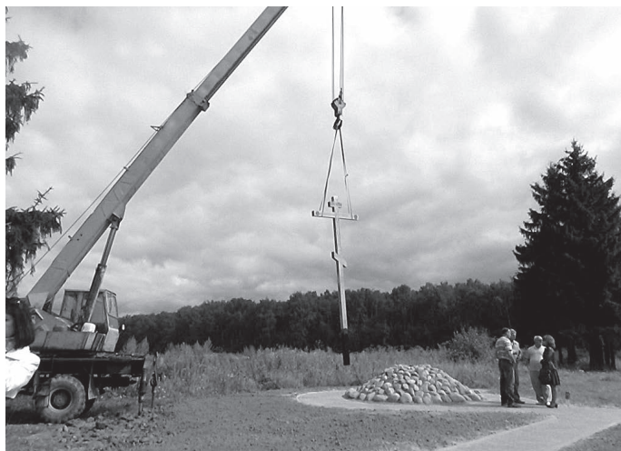
ТАК НАЧИНАЛАСЬ УСТАНОВКА КРЕСТА...

«Крест – хранитель всей вселенной, Крест – красота Церкви, Крест – верных утверждение, Крест – Ангелов слава и демонов язва»,